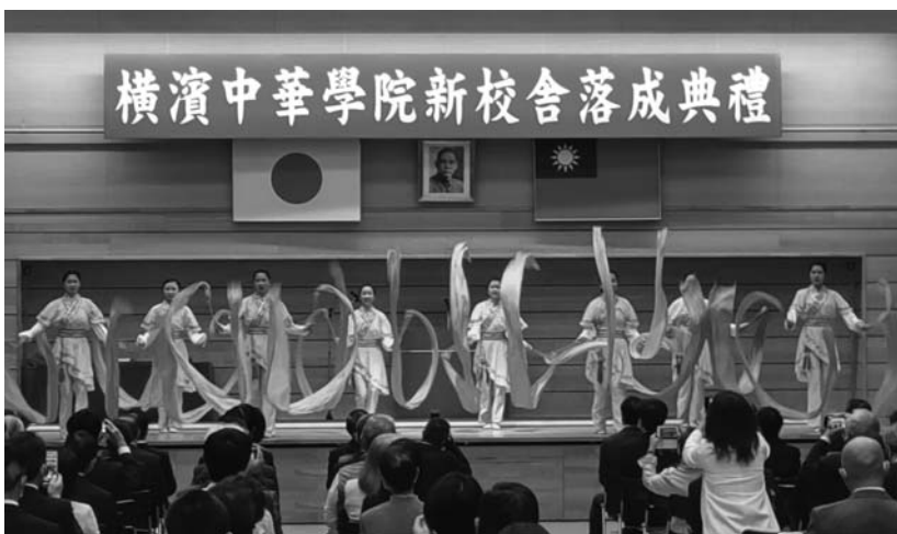
橫濱中華學院 落成式典