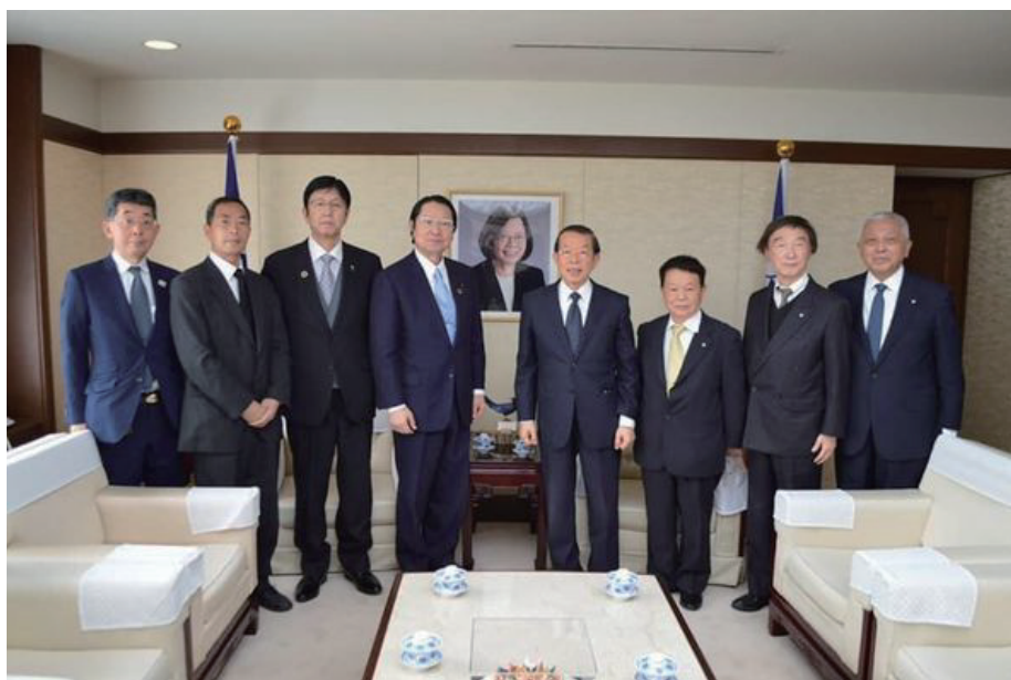
台湾列車事故弔問（令和3年4月6日）