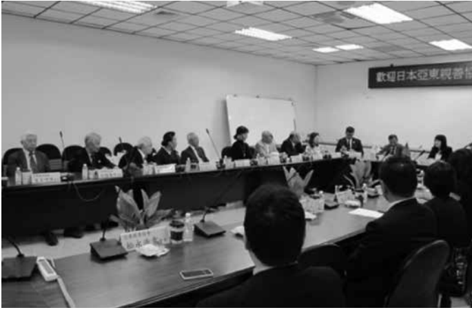
高雄市議会で説明を受ける

夕食時、専用車のガイドさんよりカラスミの話が出、購入のお世話をしてくれるとのこと、会員の数人は購入に向かった。