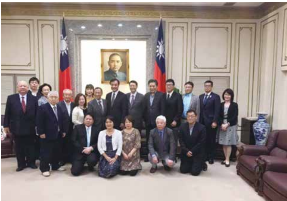
2017年度台湾訪問団（立法院表敬訪問）