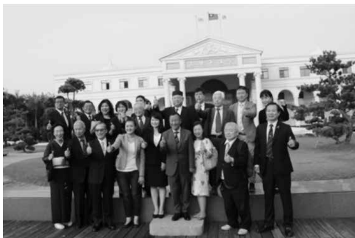
高雄市議事堂前において

男性女性議員数割合は四対一で現在六六名の中、女性議員数は二六名です。議会活動の一環として横浜市議会、大阪府・市議会、熊本市議会と姉妹関係を結んでいる。市議会で用意されている高雄市の紹介の日本語VTRを上映。最初にデカデカと画面一杯にカラスマが現れオドロキ、これぞ高雄市特産品、豊富な水産物紹介、皆さん高雄からのお土産はカラスマを